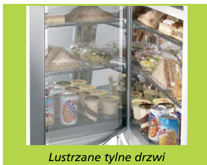
Lustrzane tylne drzwi