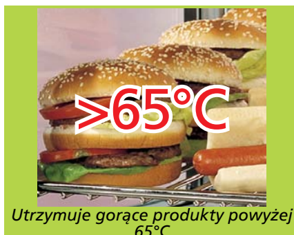
Utrzymuje gorące produkty powyżej 65°C